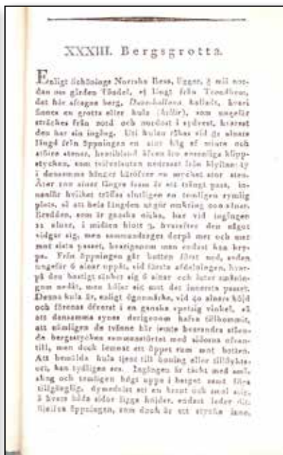
Nordiska fornlemningar, häfte V-VI, 1821.