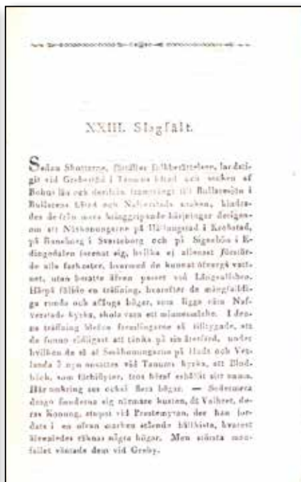
Nordiska fornlemningar, häfte III, 1819.