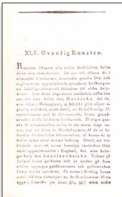
Nordiska fornlemningar, häfte V-VI, 1821.