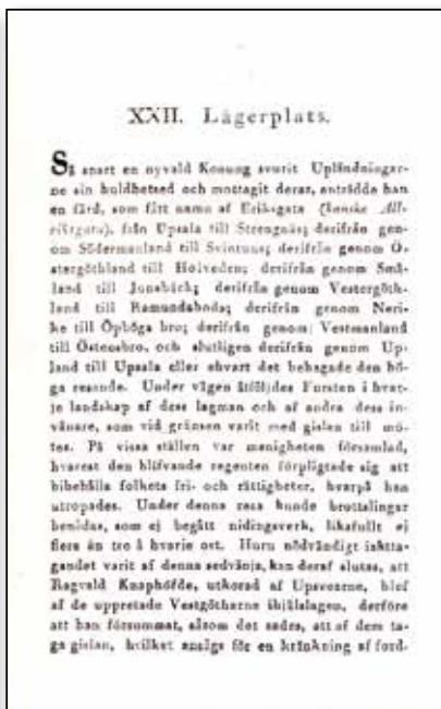
Nordiska fornlemningar, häfte III, 1819.