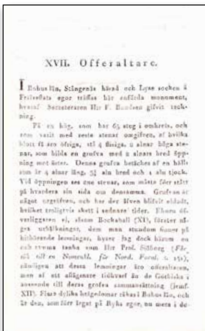
Nordiska fornlemningar, häfte III, 1819.