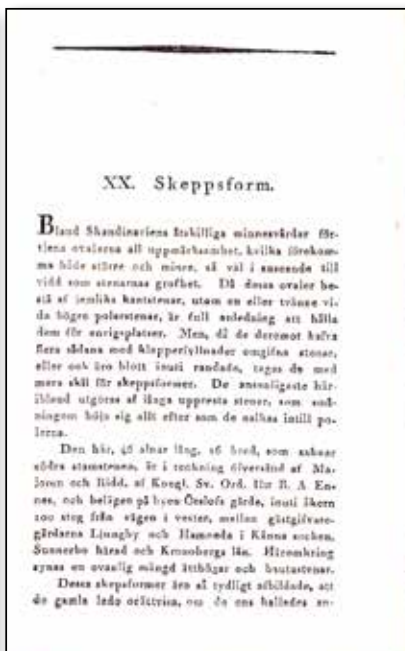
Nordiska fornlemningar, häfte III, 1819.