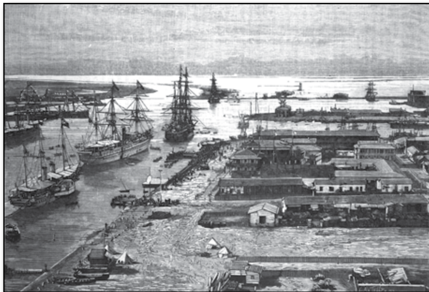
Port Said, norra inloppet till Suez-kanalen.